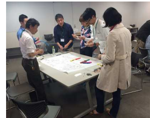
<グループ実習や模擬会議の様子>